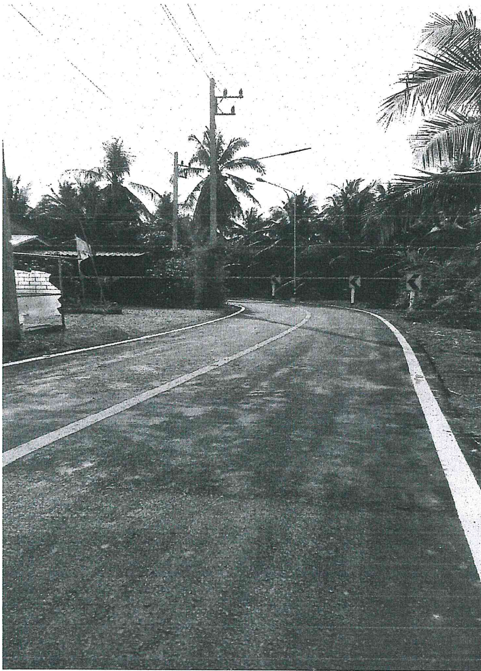
4. ติดตั้งกระจกโค้งถนนสายเรียบคลองขุดเล็ก ผู้เสนอโครงการ นางยอดขวัญ ชาน้ำวน