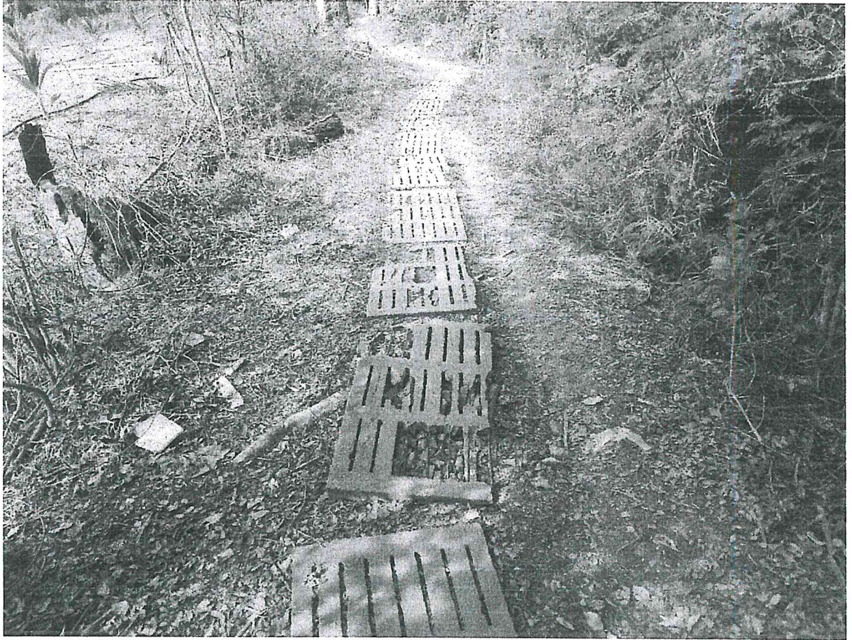
2. ซ่อมแซมพื้นทางเดินทางเท้าเข้าบ้านนายสังวาลเขนยอิงของเดิมชำรุด ผู้เสนอโครงการ นายจิตกร ปานมา